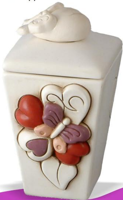
Art 3608 8x8xh15