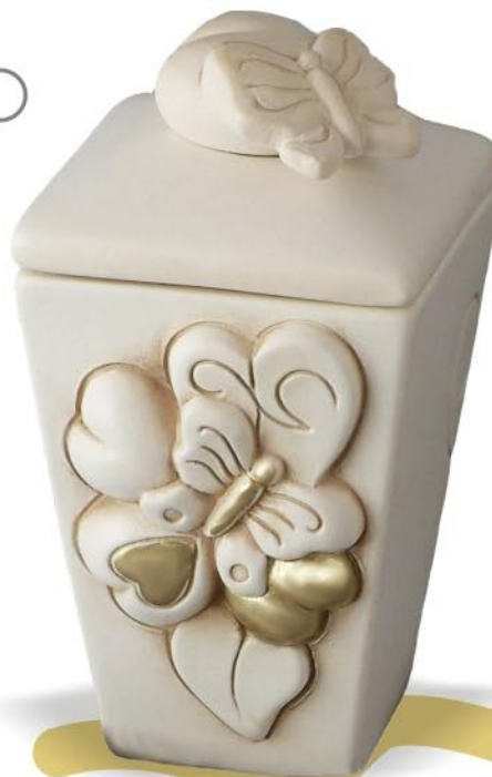
Art 3609 8x8xh15